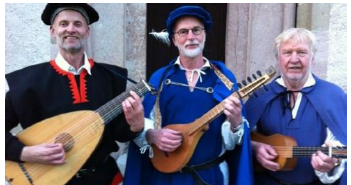
Sakralt och dansant med medeltidsensemblen Scaramella som framför musik från medeltid till renässans i Litslena kyrka på söndag den 7 februari.

Scaramella bildades i Stockholm 1989 och har en omfattande repertoar av vokal-